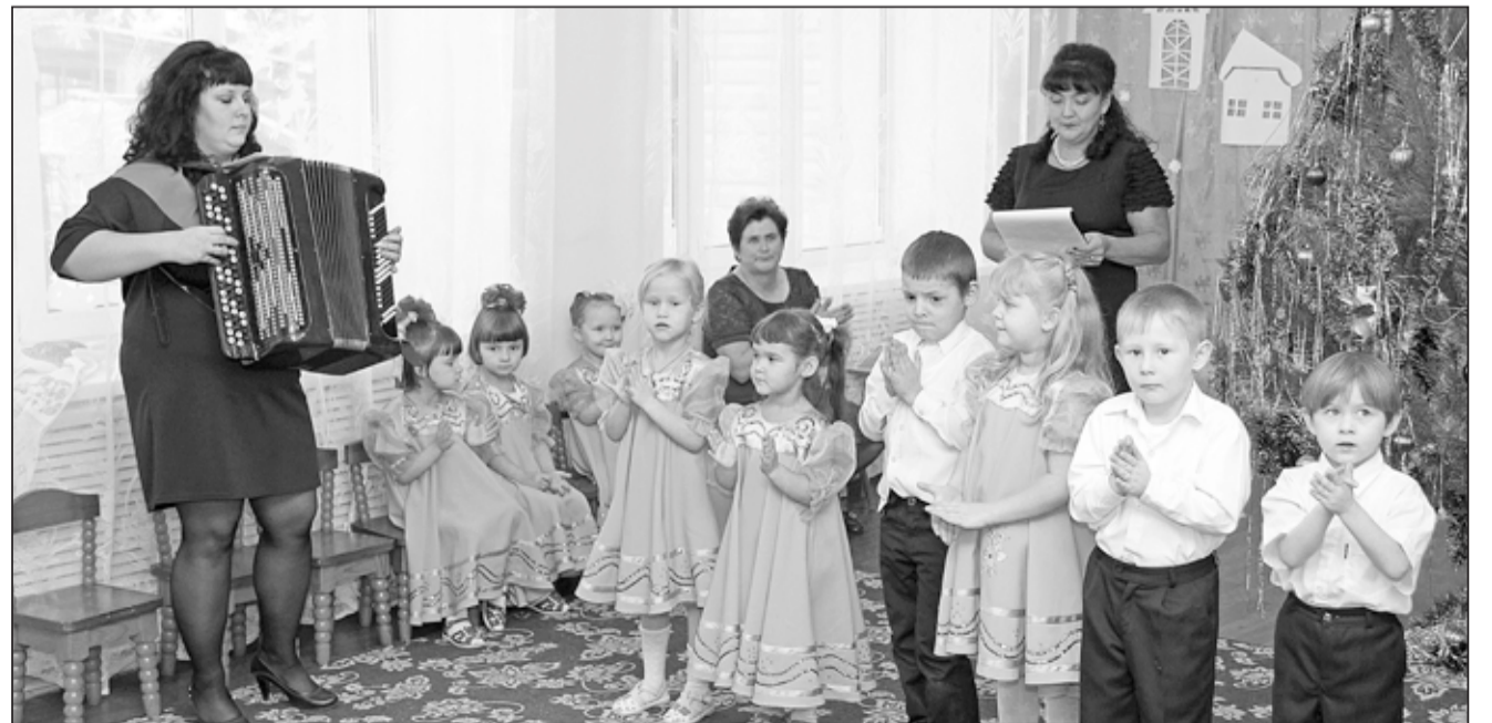
Воспитанники детского сада «Солнышко»

Наталья ГЛАДКОВСКАЯ.