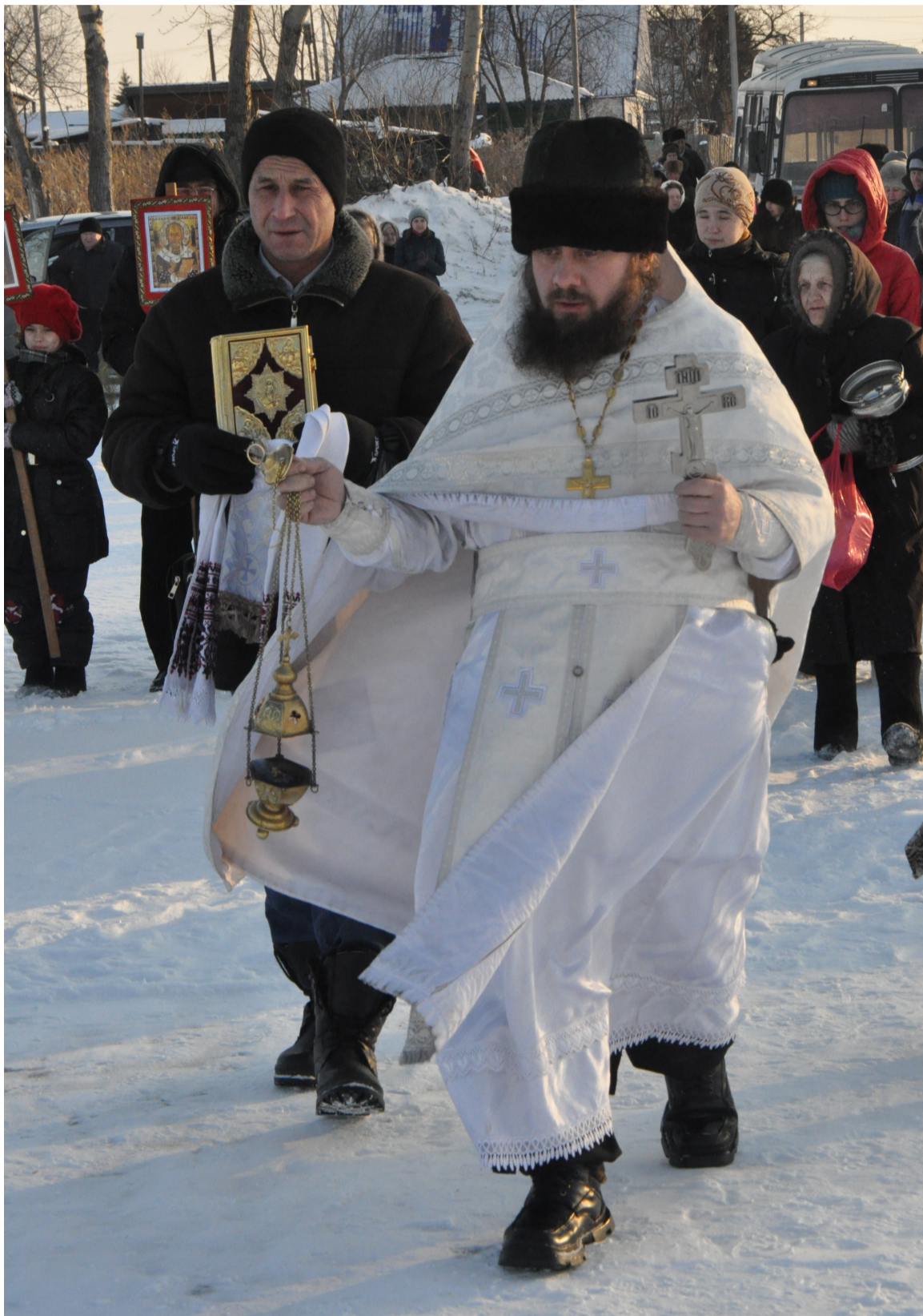
К озеру Теренкуль православные шли Крестным ходом