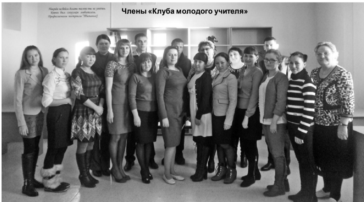
Члены «Клуба молодого учителя»