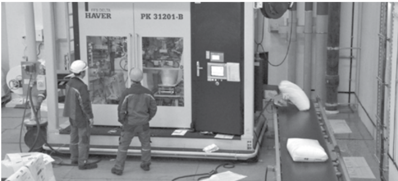
Представители российского бизнеса по переработке полипропилена посетили промышленную площадку ООО «Тобольск-Полимер».

Свыше 20 ведущих компаний страны, занятых в промышленном выпуске продукции из полипропилена, направили своих представителей для изучения одного из значимых и перспективных производств «Тобольск-Нефтехима». Встреча с руководством компании СИБУР для установления новых деловых контактов и закрепления прежних была организована по инициативе правительства Тюменской области.