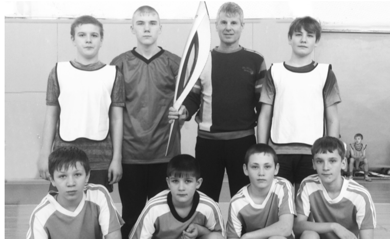
Победители турнира по мини-футболу — команда Солобеевского сельского поселения