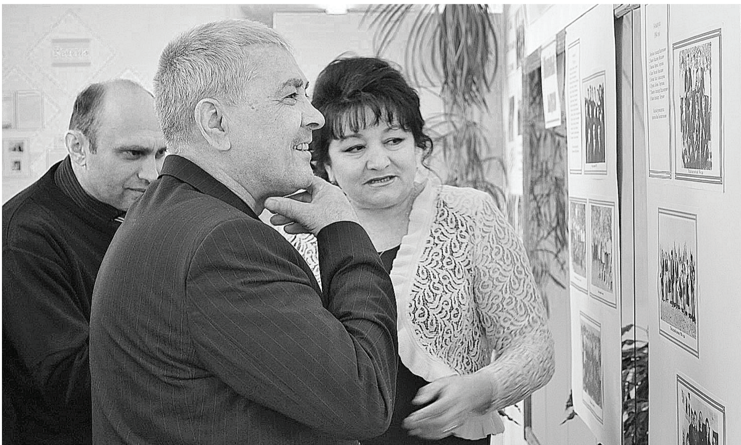
Перед началом серьёзной работы – экскурсия по школьному музею.

В 17 сельских поселениях Нижнетавдинского муниципального района пройдут встречи с населением, где будут заслушаны итоги деятельности администрации за 2013 год.