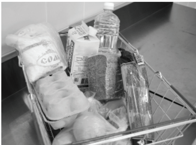
Объём потребления (в среднем на 1 человека в год) в килограммах

Растительное масло рассчитываем из стоимости 53 рубля