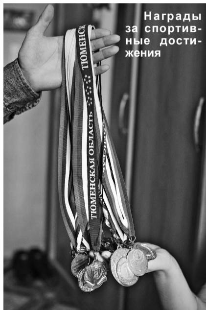
Награды за спортивные достижения