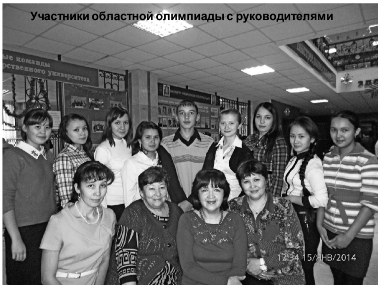
Участники областной олимпиады с руководителями

Учащиеся 9-11 классов Казанской, Тукузской, Юрминской, Карагайской школ в течение многих лет защищают честь района на областных и всероссийских олимпиадах по татарскому языку и татарской литературе. В этом году, 14-15 января, проявив себя на школьном и муниципальном эта-