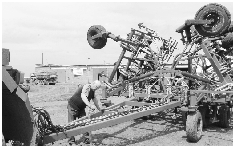
Ремонт перед полевой страдой

Не менее важным стал вопрос о нагрузке на единицу техники при проведении основных видов работ. Именно этот показатель определяет сроки и продолжительность их проведения. Между тем стратегическая задача всех уровней управлений в сфере АПК - проведение сельскохозяйственных работ с высоким качеством и в оптимальные агротехнические сроки. Чем меньше работ