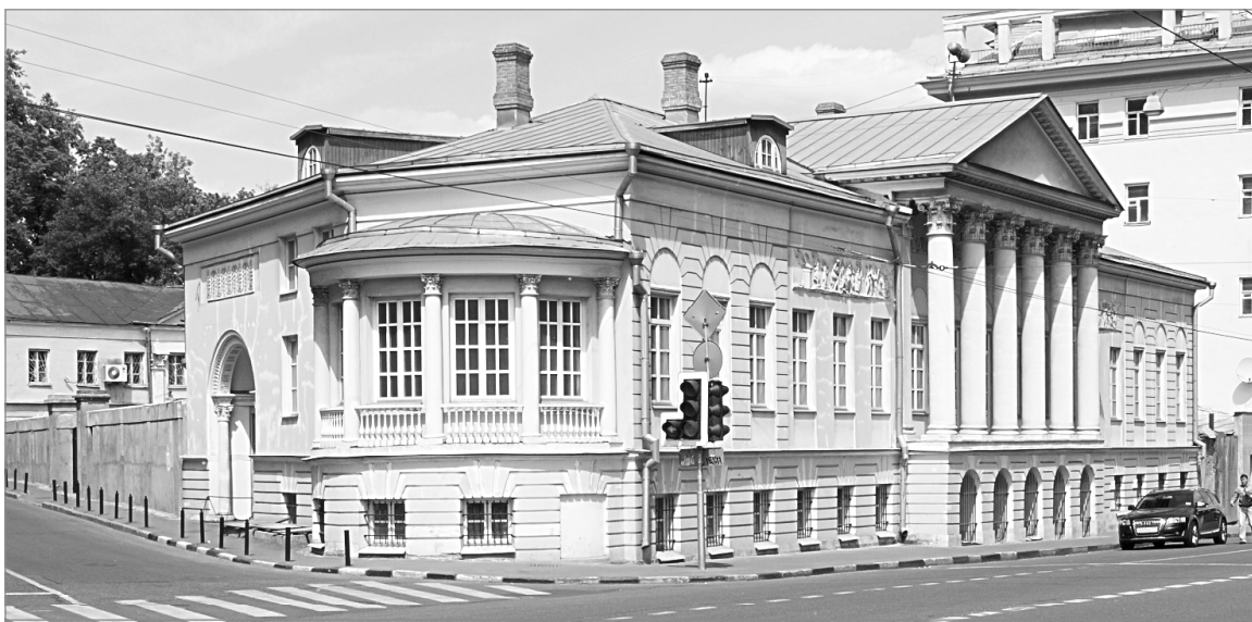
Дворянская усадьба на Старой Басманной улице