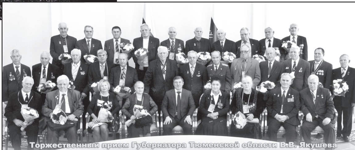
Торжественный прием Губернатора Тюменской области В.В. Якушева

Деревенская ребятня всё лето на лебедь, медушках, кисленке. Пойдут ягоды – из леса не выле-