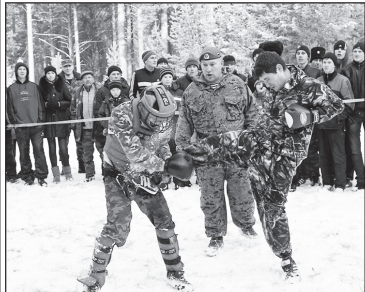
Одна из задач ЮРОО «Память» – патриотическое воспитание молодёжи