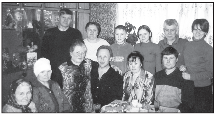
В кругу родных