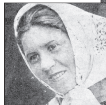
На Некрасовской ферме