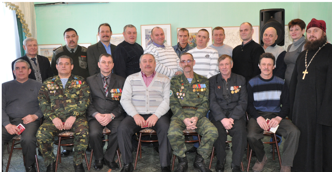
Участники боевых действий в Афганистане сфотографировались на память