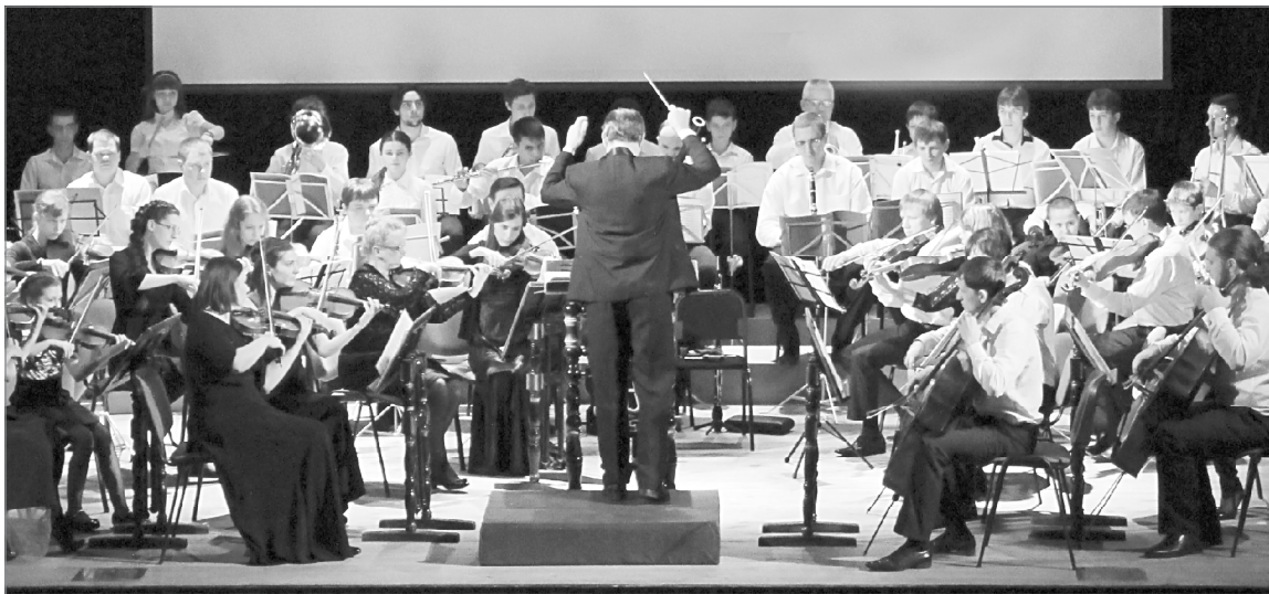
На сцене - любительский оркестр