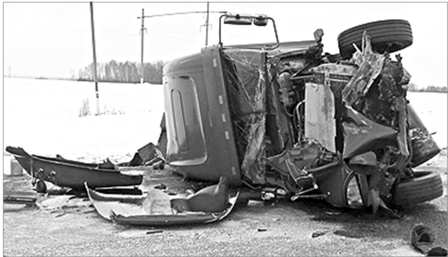
Спешка на дороге опасна