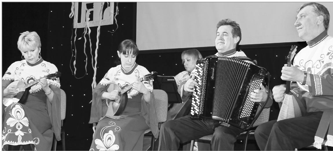
Выступает «Русское раздолье»