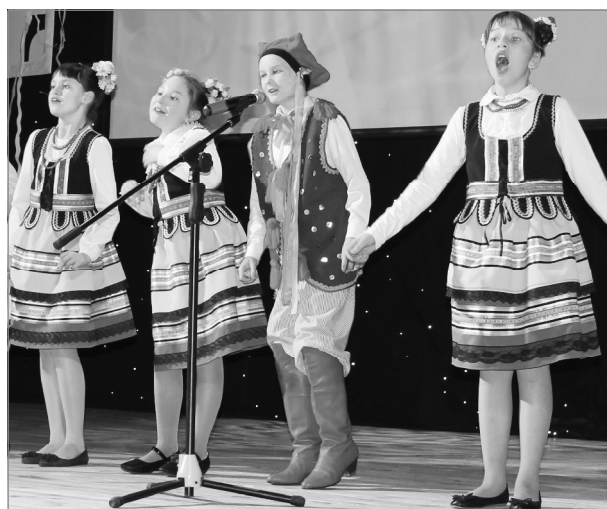
А мы из «Настоядок»