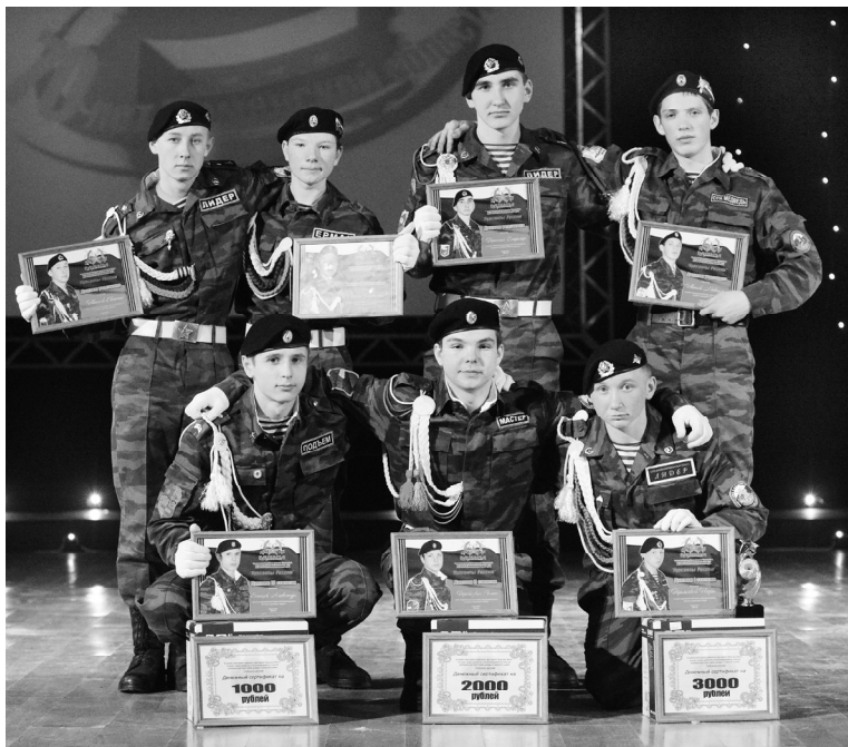
Участники конкурса «Курсанты России»