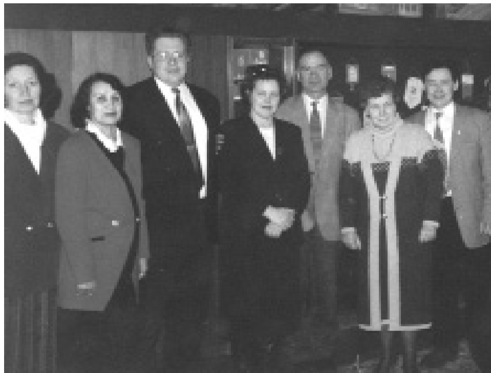
Городская дума первого созыва

– Были ли кардинальные отличия в работе депутатов в советах и в думе?