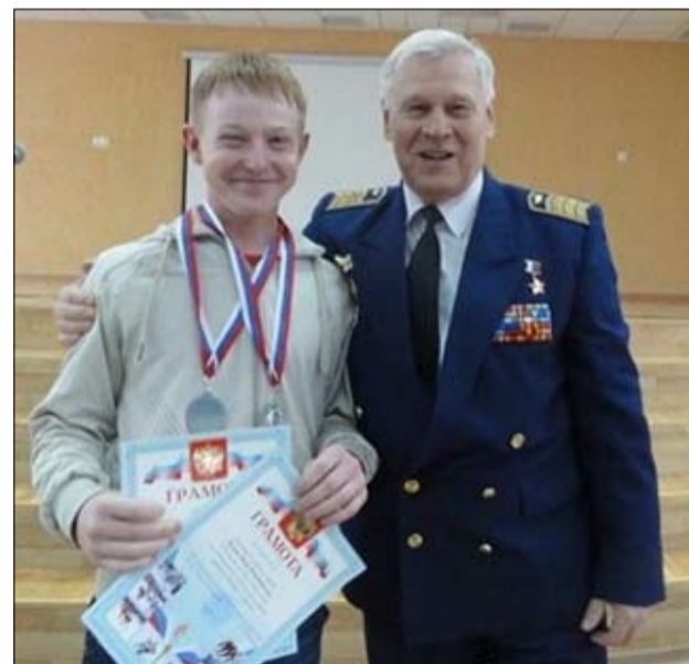
Героями не рождаются

Как депутат, я прежде всего без устали занимаюсь решением проблем своих избирателей. Конечно, не в ущерб законотворческой деятельности. Но ведь законы мы принимаем тоже во благо народа. Сейчас уже подходишь к той черте, когда не важно кресло и не важна должность. Наступает момент, и ты понимаешь, что, имея определённые возможности, надо помогать людям.