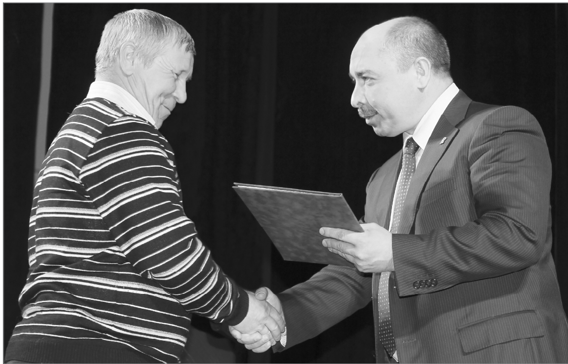
Благодарность главы города получает Фаргат Шайхиев