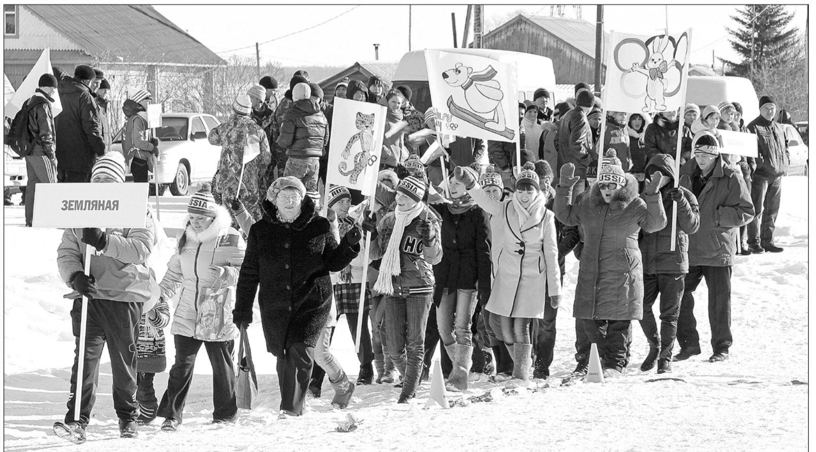
Команда Земляновского поселения – победитель соревнований