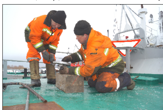
Рабочие паромной переправы проверяют инструменты.