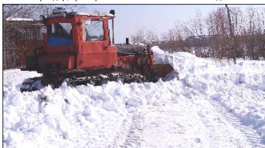
Борьба со снегом в самом разгаре.