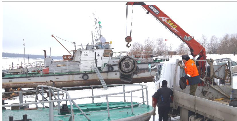
Перед установкой паромного редуктора.

Непростой навигационный сезон прошлого года и зимние месяцы изрядно потрепали и без того старенькую технику, перевозящую людей и автомобили через Иртыш в Увате. У рабочих паромной переправы Уватского ДРСУ впереди ещё как минимум месяц, для того чтобы встретить первых пассажиров в полной боевой готовности.