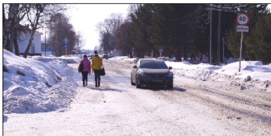
Тротуары в Увате крайне необходимы.