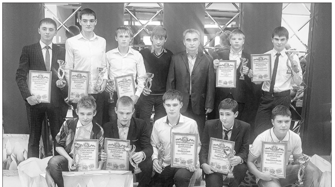
Юношеская сборная футболистов