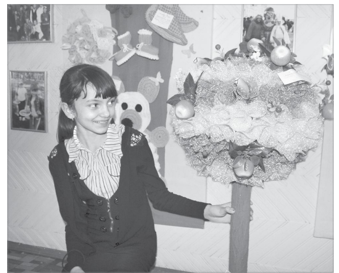
Чудо-дерево из ткани