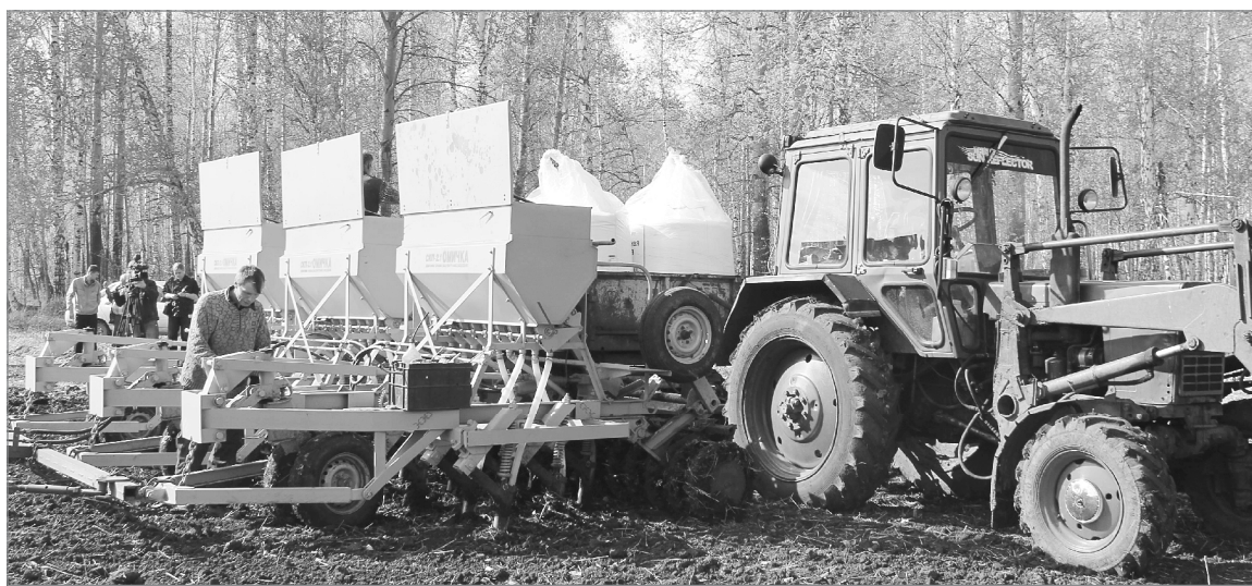
Агрегаты к началу работ