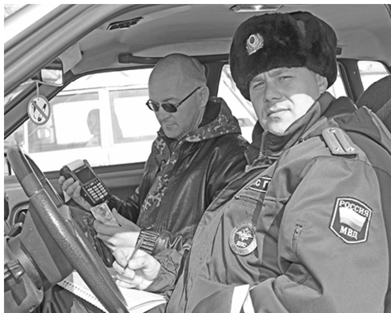
*Терминал в машине ДПС