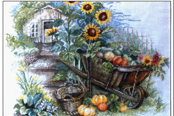
«Сельский дворик» вышила Т. Безмалая.