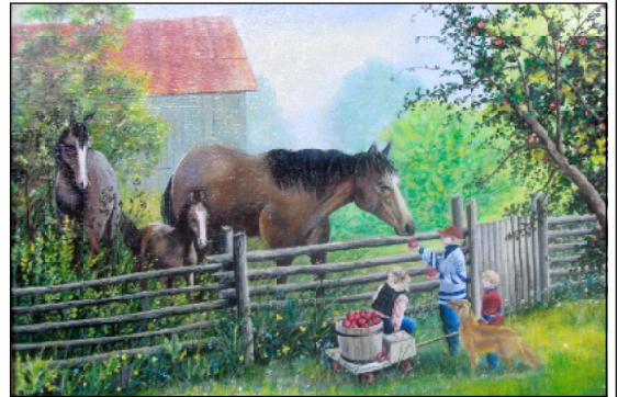
«Яблочный спас» - одна из многочисленных работ М. Шумиловой.