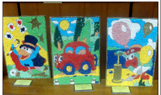
Весёлые смешарики от Е. Поляковой (пос. Музен).