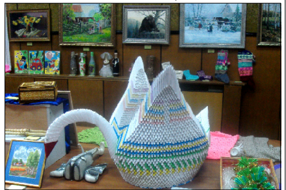
«Лебедь», выполненный в технике оригами О. Степашкиной.