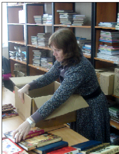
Работники библиотеки с трудом успевают паковать коробки подаренным и книгам.