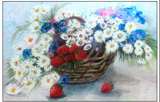
«Запах лета» С. Иголкиной.