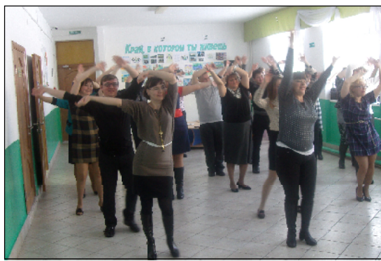
Динамическая перемена объединила всех участников «Большой перемены».