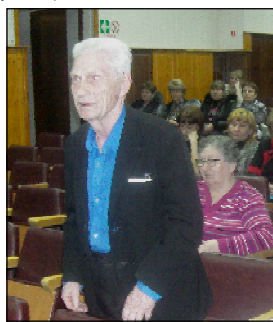
Задать вопрос решается не каждый, зато ответ интересуют многих.

гений Яковлевич. - Из 47 миллионов рублей, выделенных на ремонт дорог в Уватском районе, более 14 миллионов пойдет на ремонт дорог в Уватском сельском поселении. Так, за летние месяцы по плану будут отремонтированы улицы Октябрьская, Держинского, Калинина, Декабристов и улица в микрорайоне Кирсарай, оборудована автостоянка и проложены тротуары возле школы. На улице Ленина пройдет только ямочный ремонт.