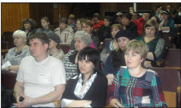
Проблемы Уватского сельского поселения волнуют каждого жителя.