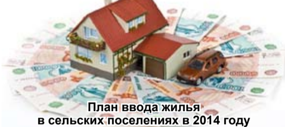
План ввода жилья в сельских поселениях в 2014 году

По имеющимся данным, на площадки ИЖС в Карачино, Тоболтуре, Пушкинском и Абалаке проведены электрические сети, а на остальных (Преображенка, Ломаева, Верхние Аремзяны, Загаздина 1 и 2, Полуянова, Сабанаки и Байкалово) ни качественных дорог, ни каких-либо инженерных коммуникаций нет. Эти вопросы – в компетенции районной власти, и при их положительном решении рейтинг привлекательности площадок ИЖС возрастёт в разы. Сельчане хотят не только жить в новых и красивых домах, но и при максимуме благоустройства на своей улице.