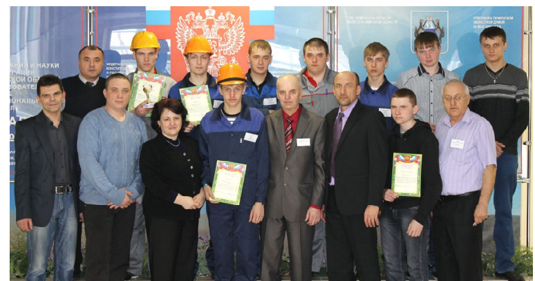
Участники и жюри конкурса электромонтеров