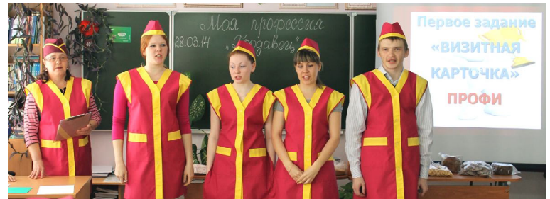
Конкурс продавцов, команда «Профи»