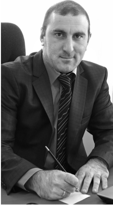
• В работе главное – оптимизм!

Полеводство у нас тесно связано с животноводством. В Соновке имеем 250 коров да в Першино 750. Только что закончили строительство молочного комплекса в Боровинке. Ждём завоза нетелей. К тому же есть в хозяйстве и молодняк. Всех надо кормить, поэтому особое внимание уделяем кормопроизводству. К имеющимся посевам многолеток нынче добавим 500 гектаров люцерны. А самое главное – сенаж будем готовить с обязательным добавлением во все траншеи дроблёного ячменя. В прошлом году уже использовали такой опыт, и надои поднялись на полтора литра на каждую бурёнку.