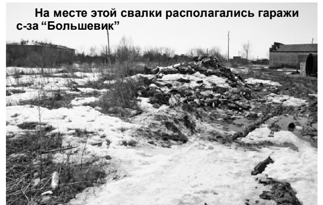
На месте этой свалки располагались гаражи с-за "Большевик"