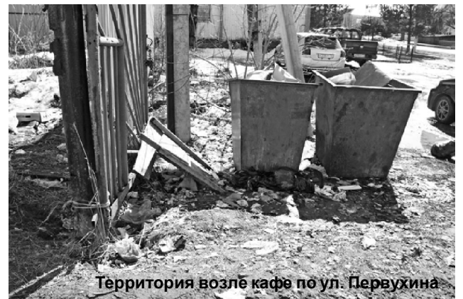
Территория возле кафе по ул. Первухина

В последние годы мы все чаще слышим и употребляем слово «экология». Пока специалисты спорят, какой смысл в это вкладывать, в обывательском понимании это значит дышать чистым воздухом, пить чистую воду, есть пищу без нитратов, ходить по чистым, незахламленным отходами человеческого бытия улицам.