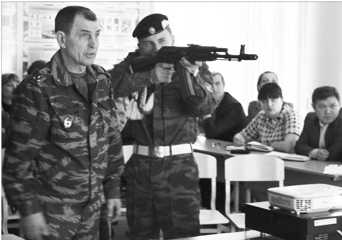
Демонстрация работы лазерного тира

Кстати, подобные кабинеты, оборудованные при финансовой поддержке областных депутатов, есть ещё в двух ялуторовских школах.