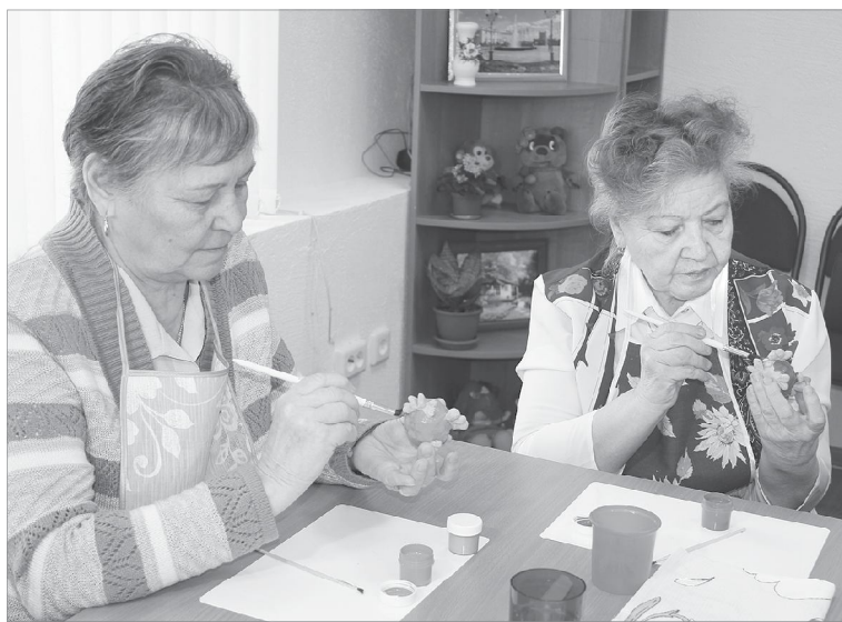
Раз мазок, два мазок...

краеведению и туризму, культуре и искусству.