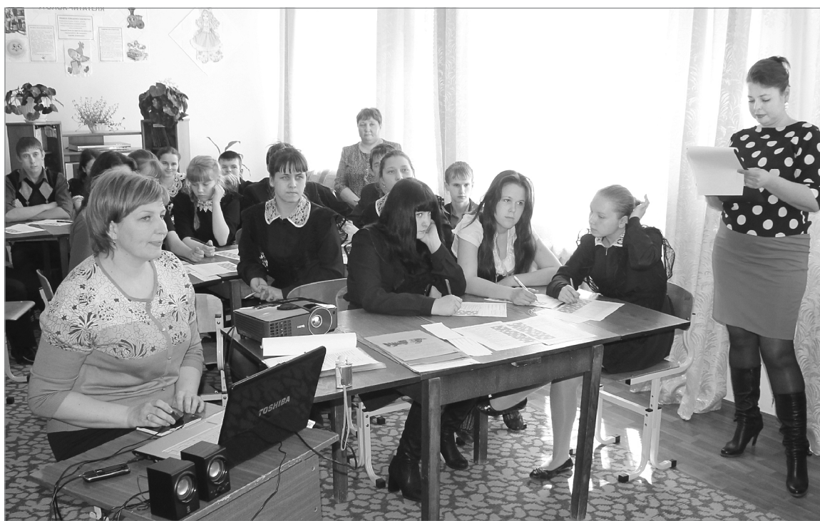
Разговариваем о будущем