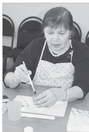
Над пасхальной игрушкой