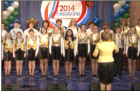
Хор Туртасской школы «Пюющие сердца».

Марияна ВОЛКОВА