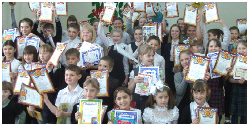
Победители и призеры научно-практической конференции «Терра incognita».