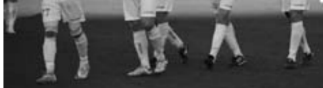
«Тобол» аплодирует болельщикам

Обеспечьте своим детям интернет-безопасность. Существует случай, когда детей выманивают из дома, потом совершают над ними различные насильственные действия. Будьте также предельно осторожны, когда берёте малолетних детей в гости даже к своим приятелям или заводите знакомства с подозрительными людьми (по Тобольску имеются случаи совершения насилия по отношению к детям так называемыми «знакомыми» и «отчимом»). Особенно печально, когда благополучные семьи терпят свои дети из-за беспечности и неосторожности. Прошлым летом были случаи младенческой смертности от выпадения из окон (из-за москитных сеток), ожога водой из чайника, утопления ребёнка в ре-