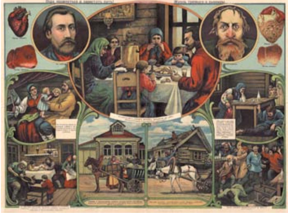
Агитплакат 1914 года

Свою лепту в решение проблемы пытался внести и гордума. 8 мая 1914 года она приняла решение: «В виду того, что по заявлениям многих граждан в пивных торгуют водкой, решено передать это отношение в комиссию для соображения, нельзя ли сократить число этих заведений?» 20 мая дума решительно постановила: «Воспреща-