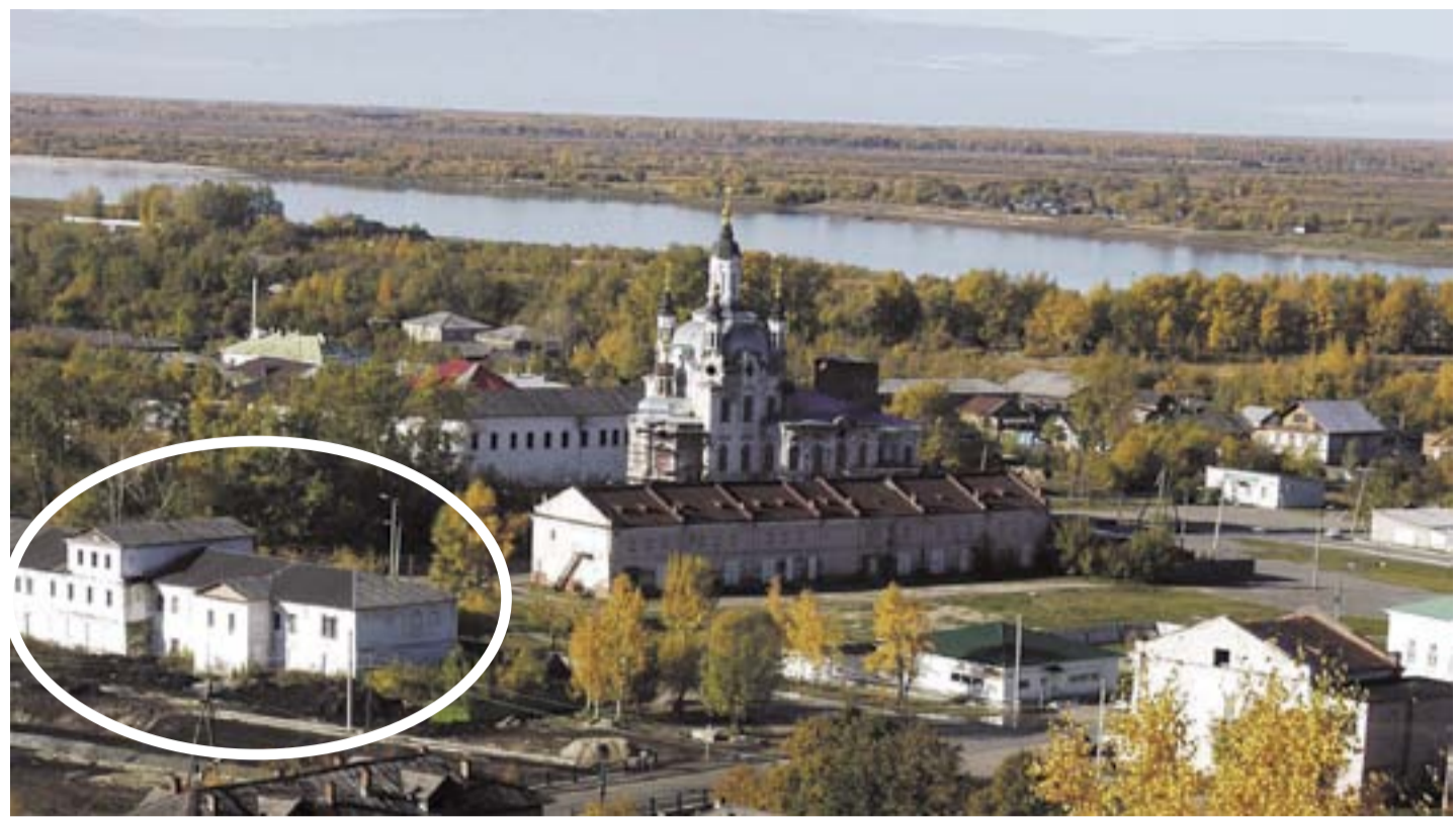
Бывший дом питейных заведений