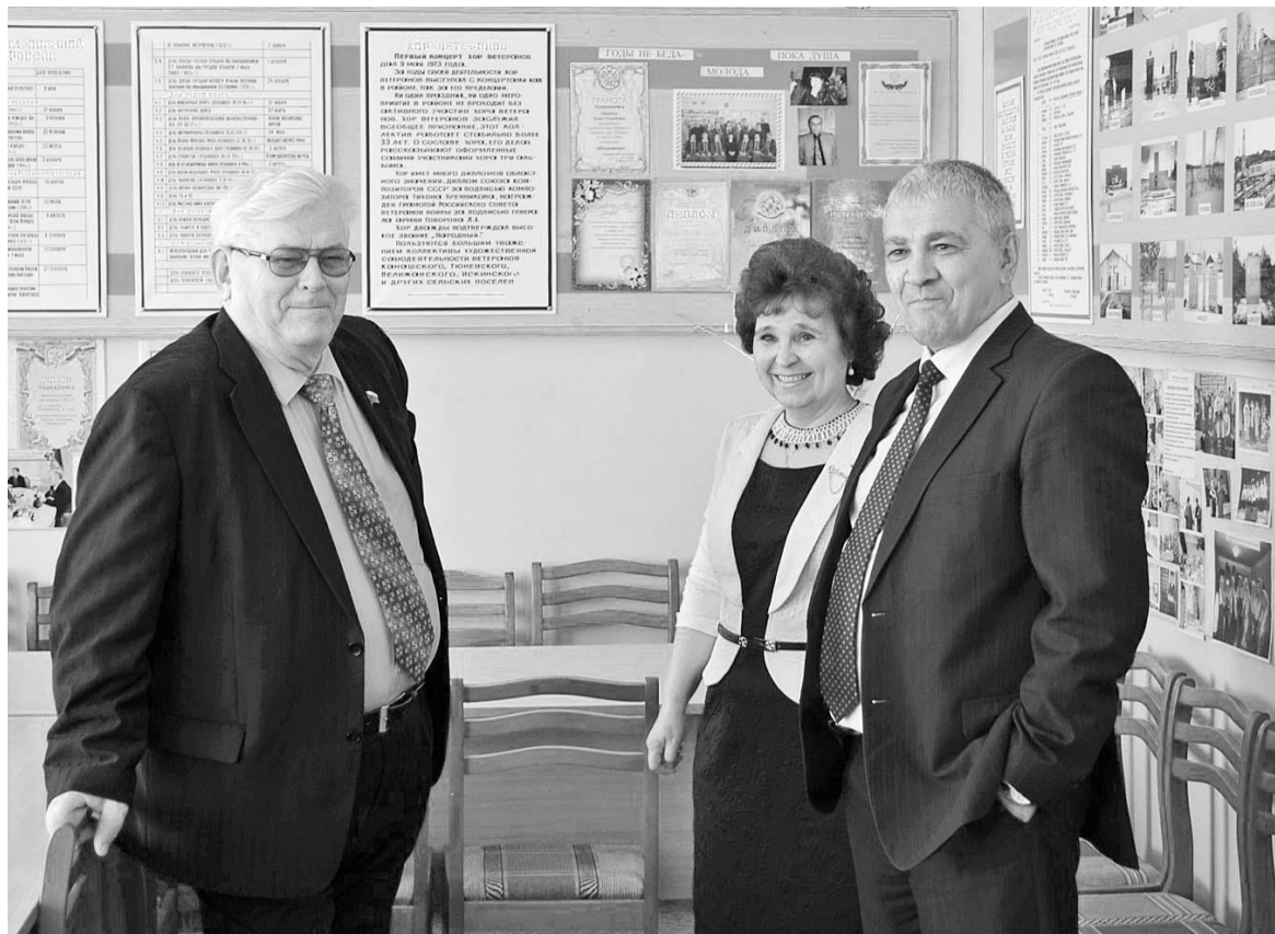
В Нижнетавдинском районном совете ветеранов. Есть взаимопонимание – есть конкретные дела.

Для поддержки ветеранов Великой Отечественной войны, ко Дню Победы члены фракции «Единая Россия» Тюменской областной Думы перечислили из личных средств 450 тысяч рублей на благотворительные счета «Победа» и «Благодарение победителей».