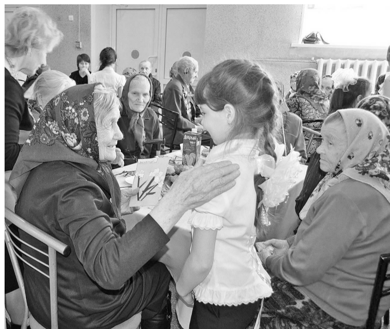
Момент встречи. Комментарии излишни.

«Наш долг оказывать постоянную поддержку ветеранам, в том числе адресную помощь. Мы регулярно встречаемся с ветеранами и тружениками тыла, уделяем пристальное внимание решению их проблем», – отметил первый заместитель председателя Тюменской областной Думы, руководитель депутатской фракции «Единая