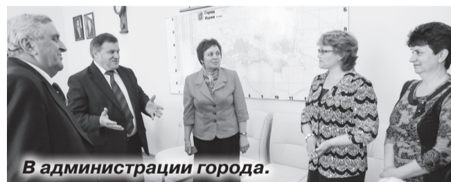
В администрации города.

В понедельник гости прощались с гостеприимными хозяевами. Последняя остановка по пути домой была в