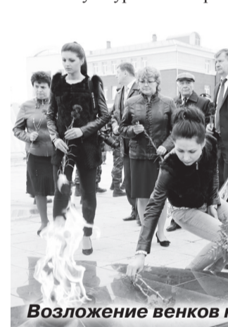
Возложение венков к мемориалу.

сении, 25 мая, они побывали на местах памяти погибшим воинам, возложили цветы к мемориалу на Соборной площади и у стелы в Сеницынском бору – на месте формирования 229-й и 384-й стрелковых дивизий. Посетили базу отдыха Ишимской обувной фабрики, где в музее-землянке хранятся экспонаты военных лет.