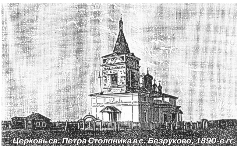
Церковь св. Петра Столпника в с. Безруково. 1890-е гг.

Заботы об устройстве церкви стали для Ершова одним из самых отрадных занятий до последних минут его жизни. Для покупки некоторых церковных предметов заложил он однажды золотую цепочку от часов своих, о чём сказал жене уже только в конце своей последней