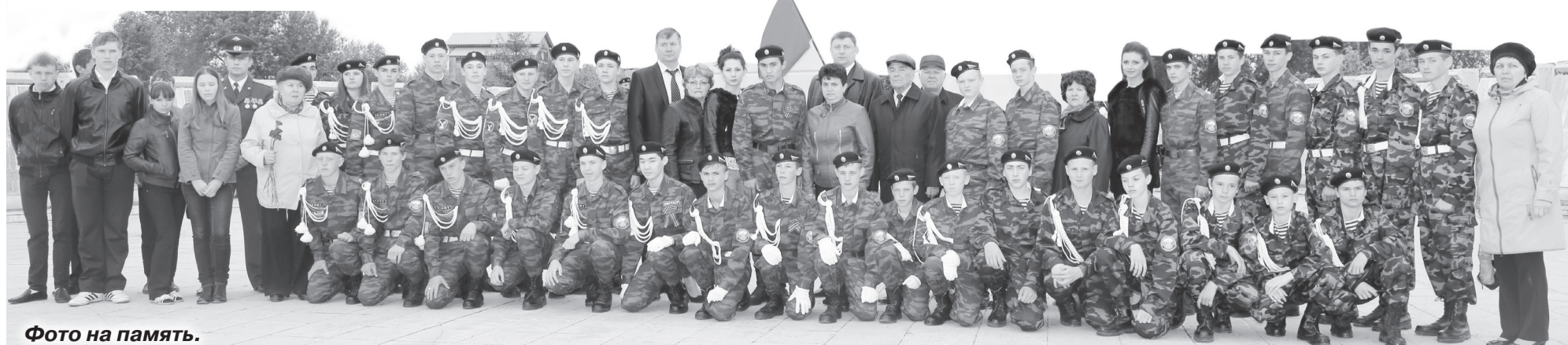
Фото на память.

– Вопросы воспитания подрастающего поколения находятся в разряде первоочередных. Наша задача – передать молодёжи память о поколении победителей.