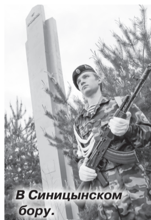
В Сеницынском бору.

Родину. Мы ежегодно проводим перезахоронение на Поклонной горе поднятых из земли останков солдат, их уже более 700 человек. Очередное захоронение – ещё