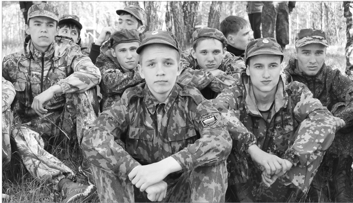
Ребята трудностей не боятся