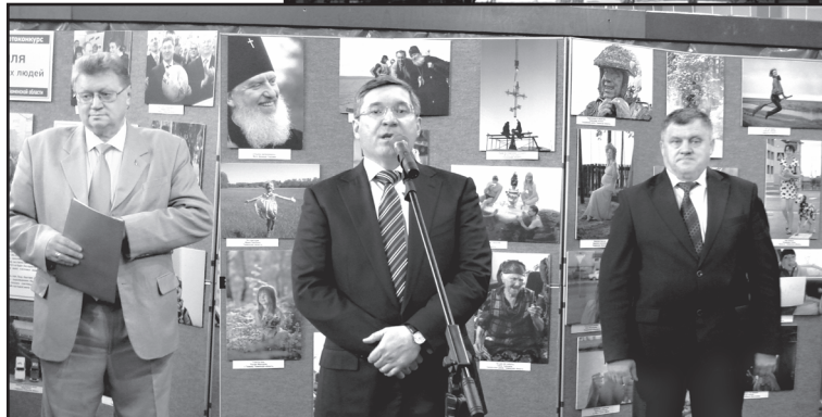
Открытие фотовыставки «Сибирь – земля счастливых людей»

В этот свой приезд я «открывала» Ишим заново для себя. Бесконечно признательна организаторам, департаменту информационной политики области, Тюменскому Союзу журналистов и Медиа-союзу за возможность увидеть город юности снова.