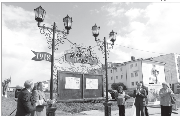
Скверы называют улыбкой города