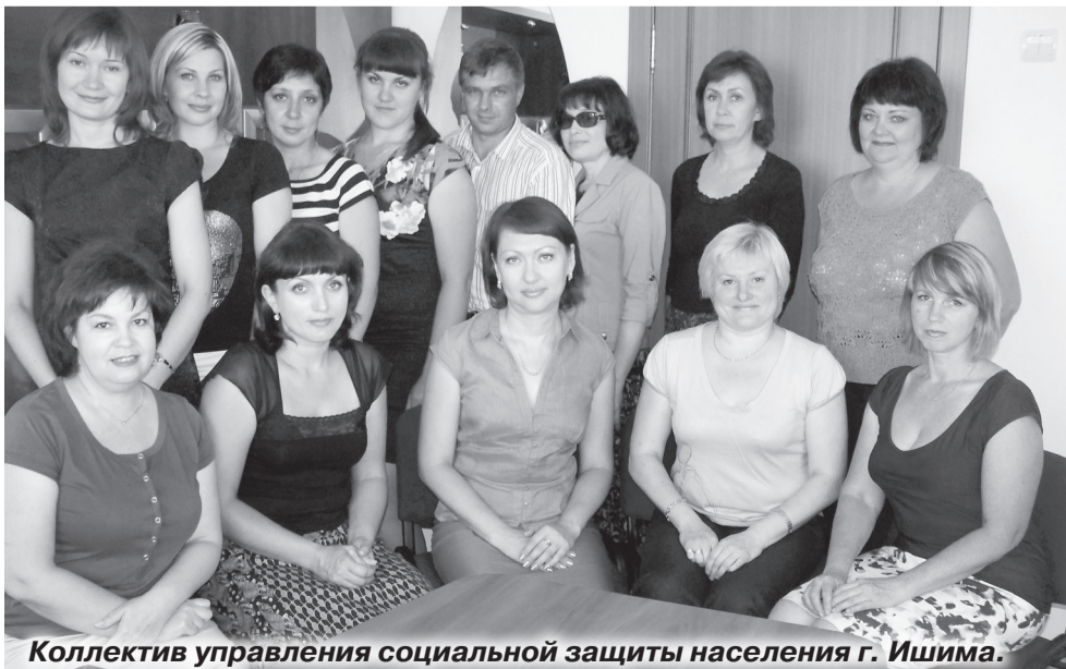
Коллектив управления социальной защиты населения г. Ишима.