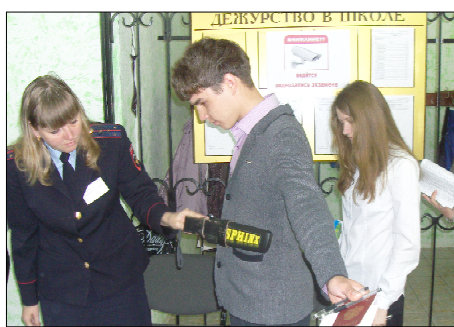
Досмотр по всей строгости.