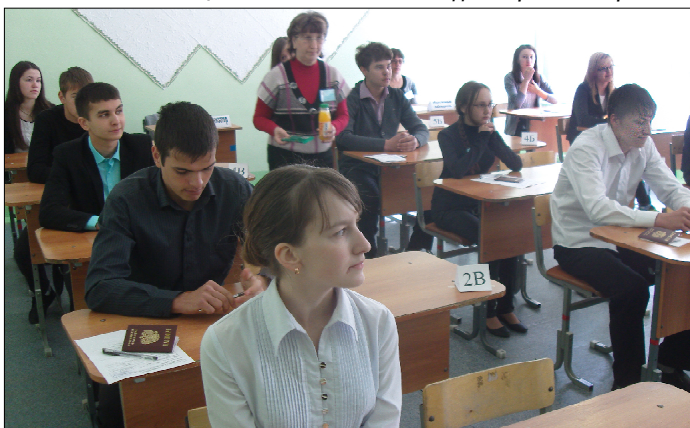
Последние инструкции перед экзаменом.