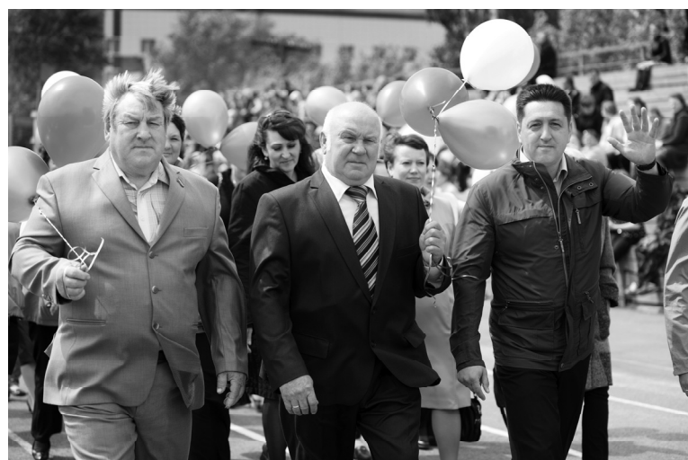
Представители Омутинского поселения

После официальной части мероприятия состоялось увлекательное шоу - игра «Большие гонки».