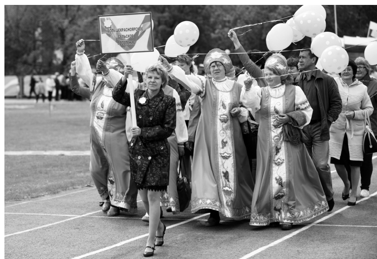
Колонна Б-Красноярского поселения