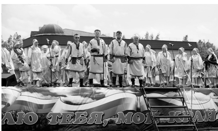
На сцене коллектив «Пересвет»