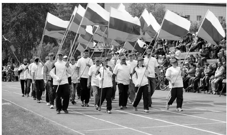
С триколорами России идут спортсмены