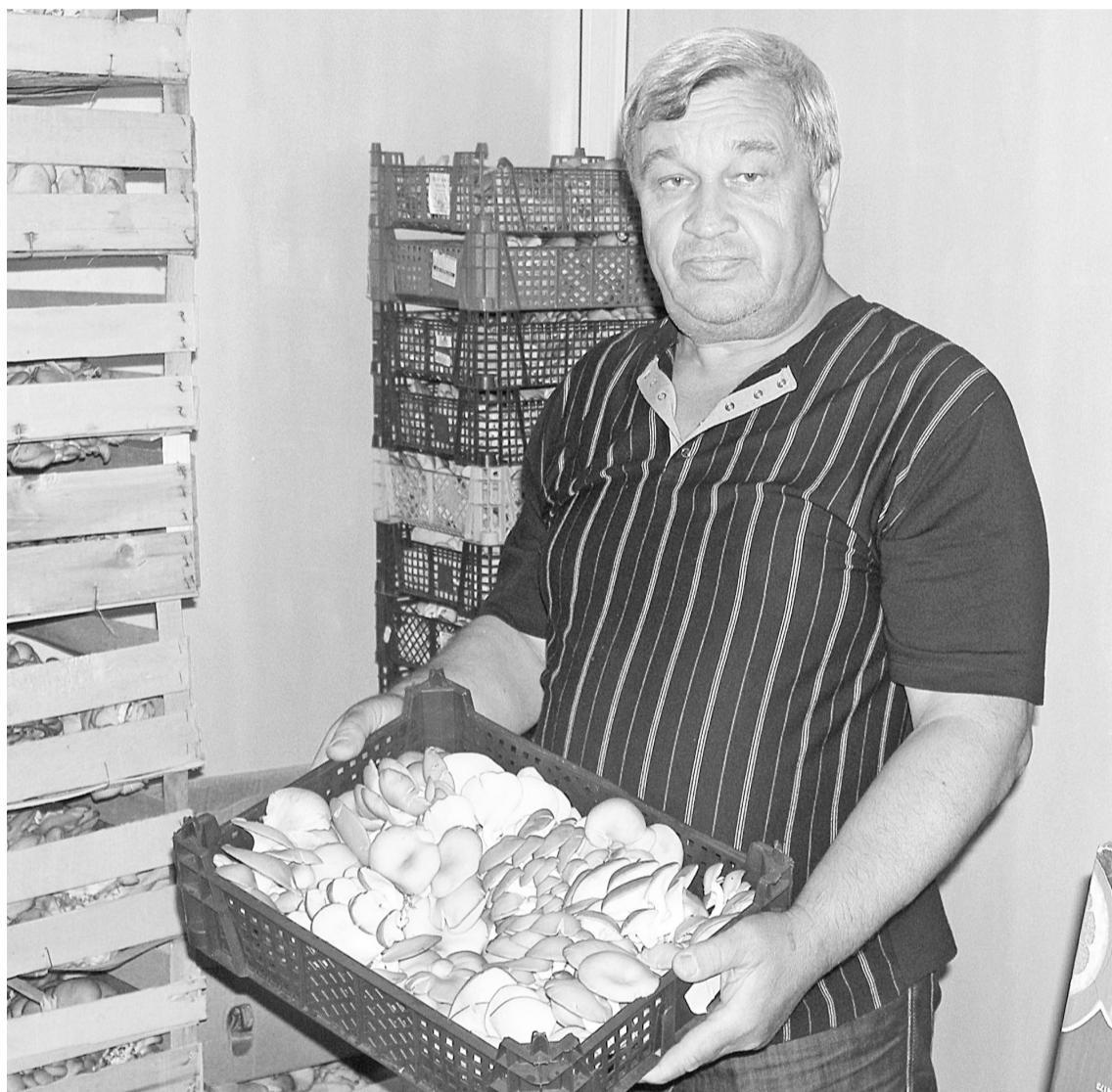
Хотите отведать вешенок?

Основными потребителями сегодня являются предприятия торговли и общественного питания областного центра, а также ООО «Паллада». На селе вешенки не котируются, хотя эти грибы можно отнести к деликатесам.