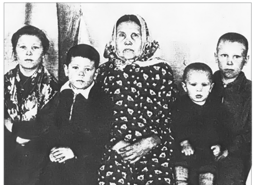
Бабушка с внучатами