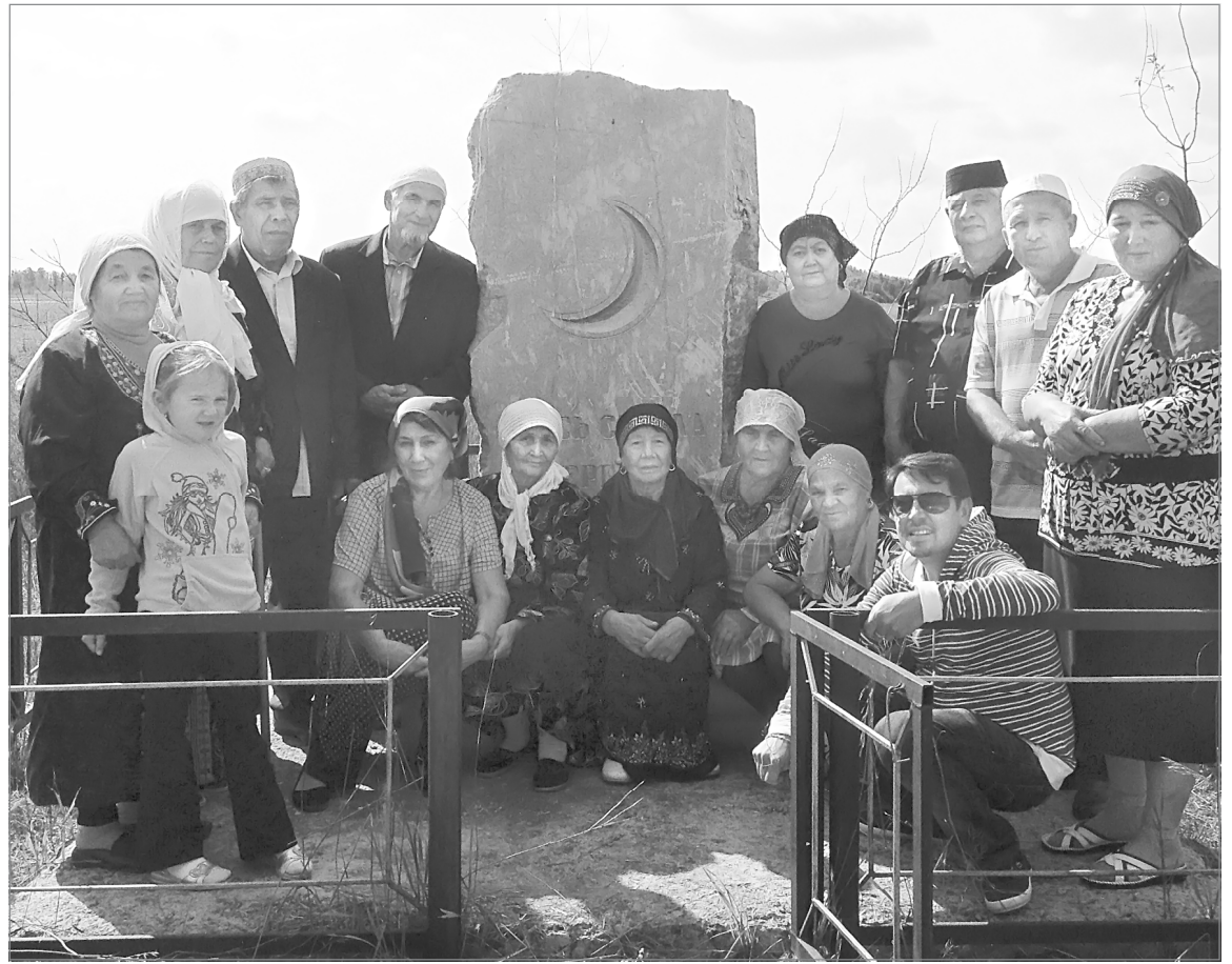
Кашагальцы у памятного знака

В 2009 году, благодаря районному отделу культуры и средствам бывших кашагальцев и их родственников, на месте исчезнувшей деревни появился памятный знак - гранитная сте-