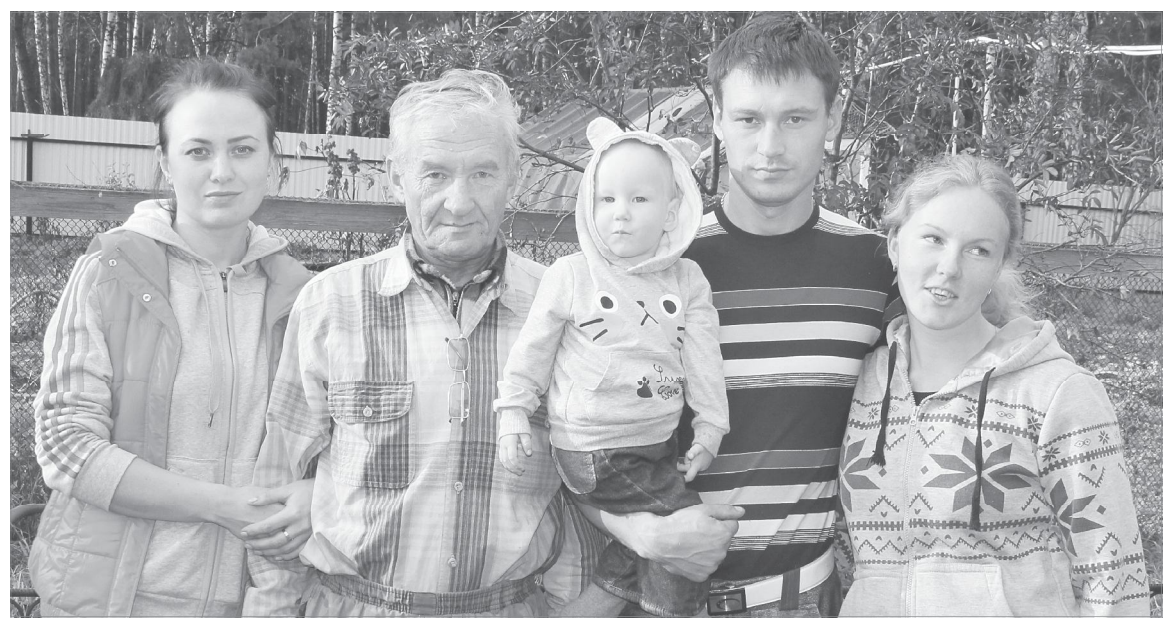
Половина семьи в сборе

Выбор профессии был предопределён. Наш герой решил посвятить свою жизнь сельскому хозяйству: в 1982 году окончил