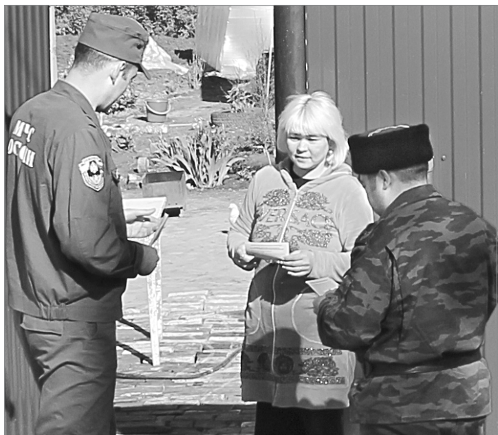
Беседы о пожарах помогают предотвратить беду