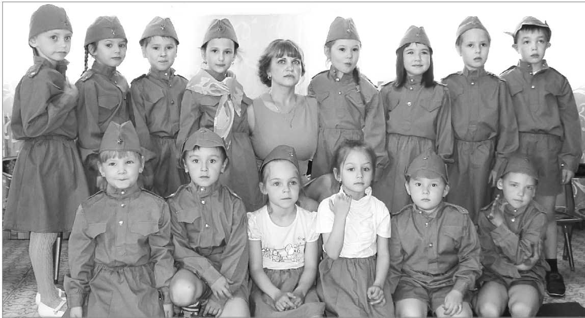
Вот они, юные артисты из центра развития ребёнка