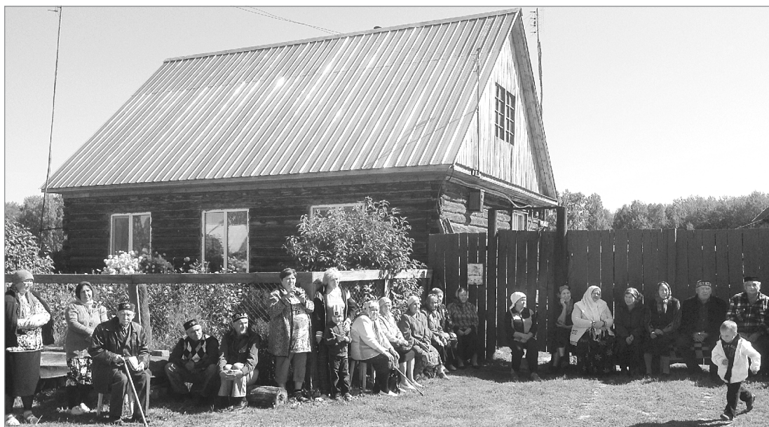
Они жили в Кашагале...