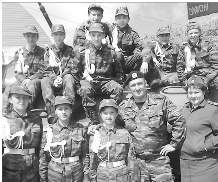
Спецкласс «Гвардия» из школы № 4

И напоследок полезная информация для автолюбителей. С 15 июня в связи с производством ремонтных работ ограничено движение по улице Агеева (от ул. Бахтиярова до ул. Лесной), неудобство это временное, нарушение - соблюдать требования дорожных знаков.