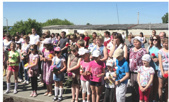
22 июня 2014 года у памятника в с. Омутинское