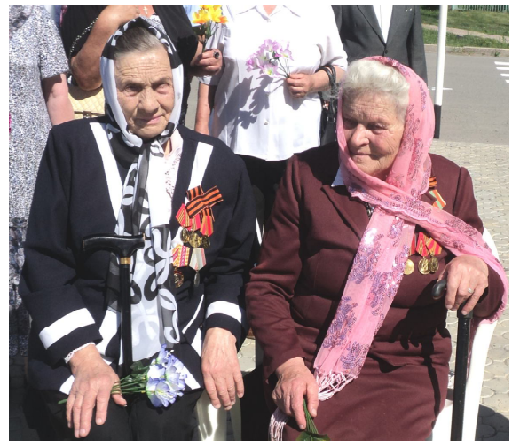
Ветераны на мероприятии, посвященном Дню памяти и скорби

- Потому что в этот день началась Великая Отечественная война. А к памятнику я ходить буду, в память о тех, кто воевал.