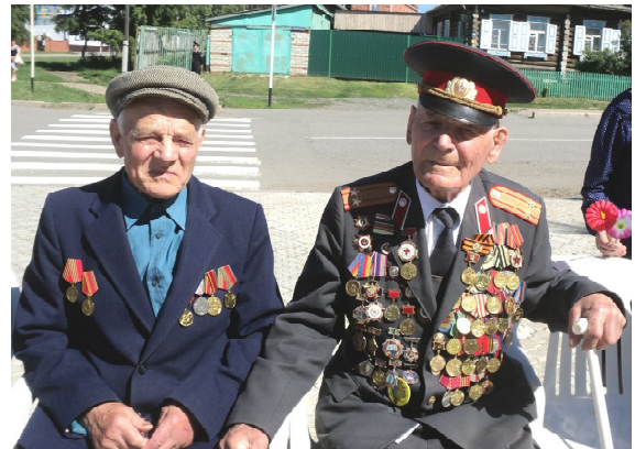
Старшему поколению - почет и уважение

22 июня ровно в четыре часа Киев бомбили, нам объявили, Что началась война.