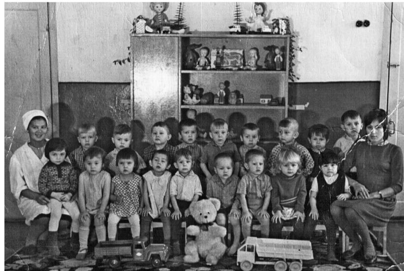
Первая группа детского сада

За годы работы нашего учреждения в статусе школы-интерната с 1973 по 1988 сменилось около десяти директоров. Капитальный же ремонт требовался уже в 1983 году. Поскольку многое было разрушено руками воспитанников.