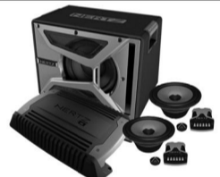
Автомобилотоллы, акустика, сабвуферы.