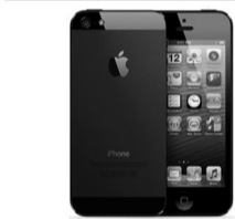
Смартфоны, сотовые телефоны

По всем вопросам, связанным с необходимостью подключения к системе водоснабжения, обращаться: МУП ЖКХ «Вагай», с. Вагай, ул. Речная, 10, тел.: 8(34539) 2-16-59 (факс), 2-15-71.