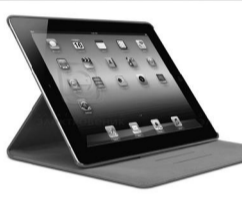
Планшеты с 3G