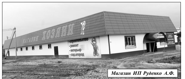
Магазин ИП Руденко А.Ф.

Ольга ЯКОВЛЕВА, Фото Сергея ЧЕКУНОВА, Ольги ЯКОВЛЕВОЙ.