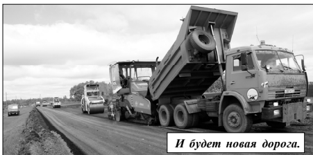
И будет новая дорога.