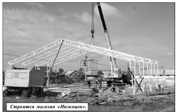
Строится магазин «Низкоцен».