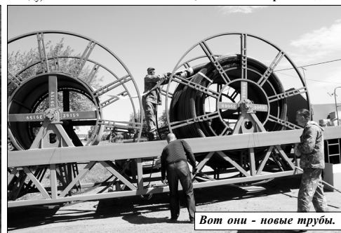
Вот они - новые трубы.