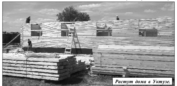
Растут дома в Уктузе.