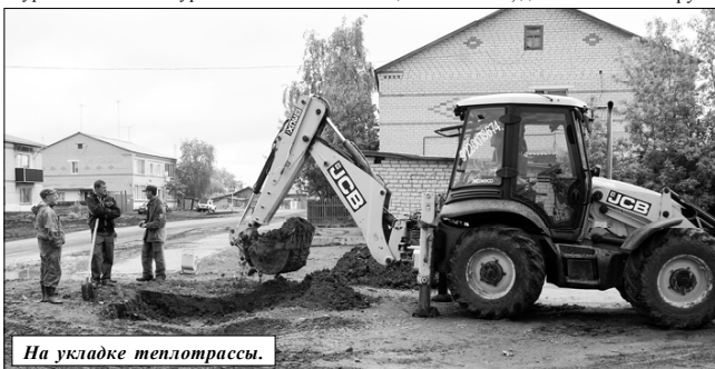
На укладке теплотрассы.