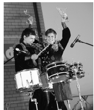
Гости из Тюмени: барабанное шоу