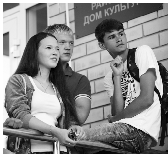
На бал выпускников пришла молодежь

Каждый из поощренных - неравнодушный к происходящему вокруг человек, се-