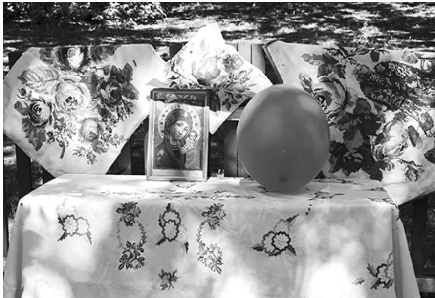
* Вот такие в Красивом мастера!