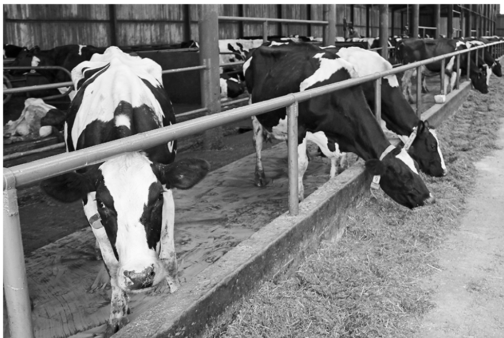
* Новый пол для элитных бурёнок

В текущем году на Никулинской ферме СПК «Таволжан» начались работы по модернизации животноводческих объектов.