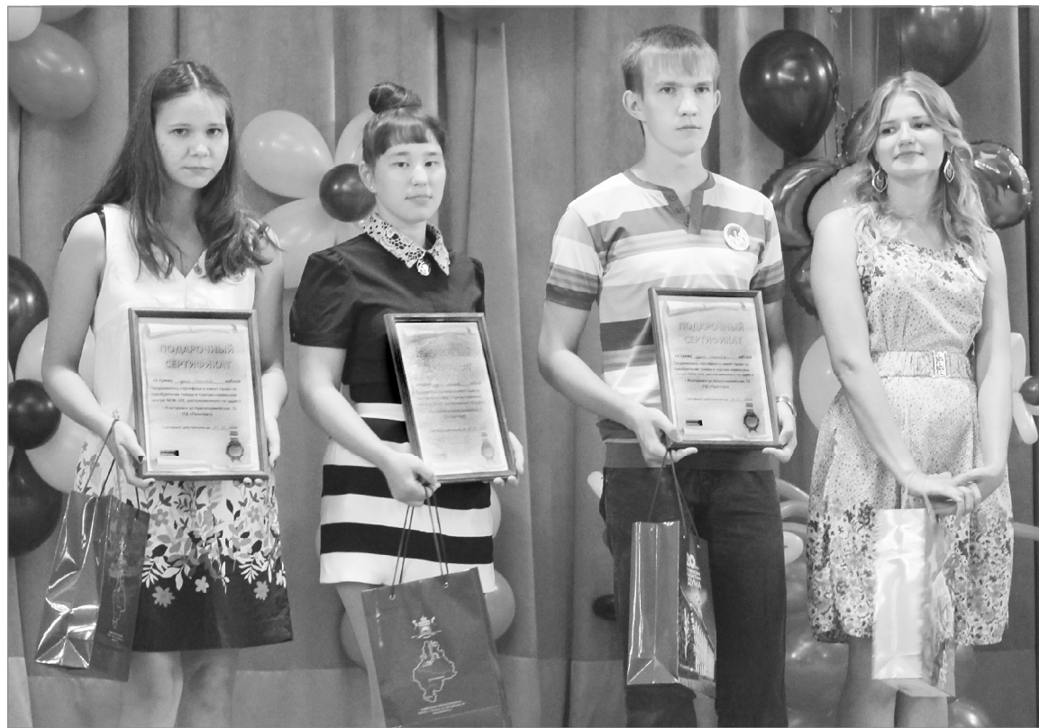
Призёры и победители областного конкурса сочинений «Моя будущая семья»

А лучшие танцевальные коллективы, вокалисты, музыканты района и аграрного колледжа преподнесли виновникам торжества творческие подарки.