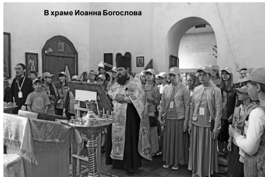
В храме Иоанна Богослова

ской православной гимназии, духовенство города и паломники. От Абалакского монастыря верующие проследовали к Иоанно-Введенскому женскому монастырю.