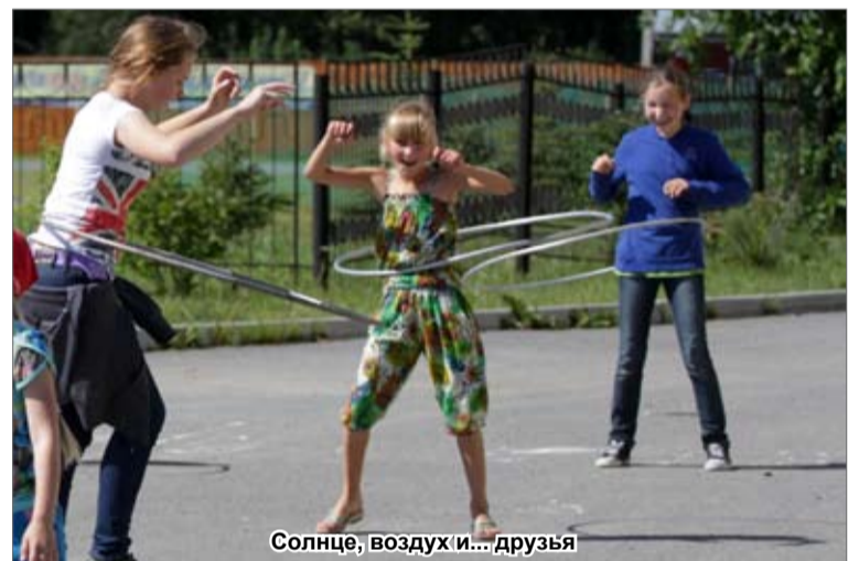
Солнце, воздух и... друзья