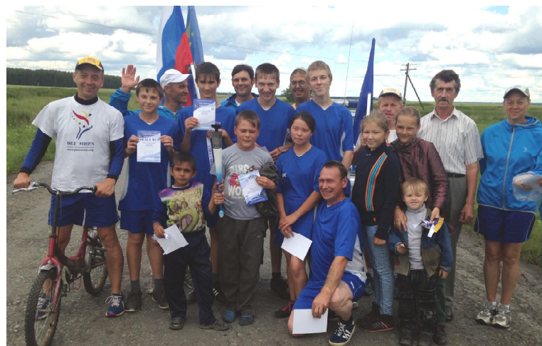
В «Бег Мира» включились южноплетневцы

прекрасных мест, интересных людей. Нас приглашают посетить музеи, библиотеки, столько нового узнаешь. Конечно же, вдохновляет сама идея. Когда берешь в руки факел, ощущаешь единство со всем миром.