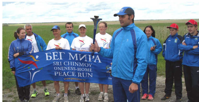
Всемирная факельная эстафета на границе Омутинского и Армизонского районов

19 июля по территории Омутинского района прошла Всемирная факельная эстафета «Бег Мира». Участники эстафеты в олимпийском стиле передавали из рук в руки горящий факел, как символ доброй воли, стремления к гармонии и единству. Независимо от возраста и уровня подготовки каждый мог принять участие в этом марафоне - достаточно было пронести зажженный факел хотя бы несколько метров или просто поддержать его в руках. С момента создания эстафеты в 1987 году в ней приняли участие более шести миллионов человек. С тех пор факел побывал более чем в 140 странах и на шести континентах. С 1991г. Всемирная эстафета проходит по просторам России. Тысячи бегунов из разных регионов страны несут факел Мира, вдохновляя все новых добровольцев. Немало энтузиастов нашлось и в Омутинском районе.